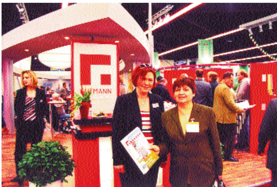
На выставке fensterbau / frontale в Нюрнберге

Выпущено 12 номеров журнала «Окна и Двери», 6 номеров «Стены и