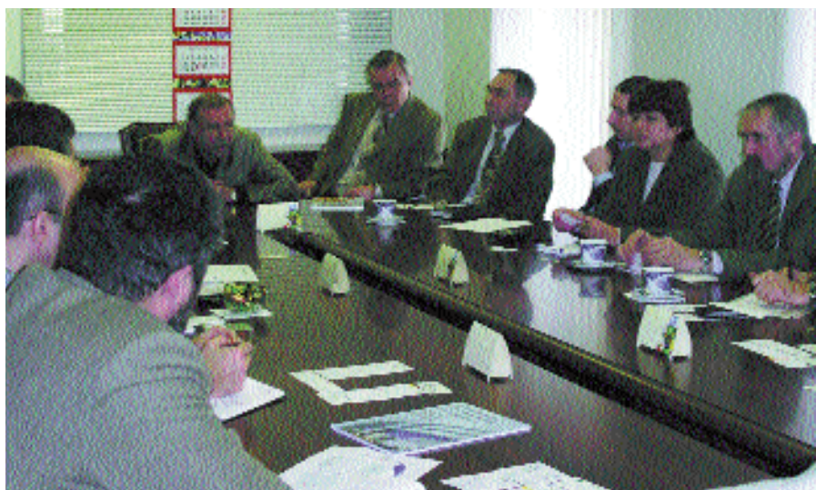
На совещании в Национальном институте технического регулирования

Совместно с РНТО строителей проведена научно-техническая конференция «Строительная теплофизика. Вопросы энергосбережения и обеспечения микроклимата в зданиях». Издан сборник докладов.