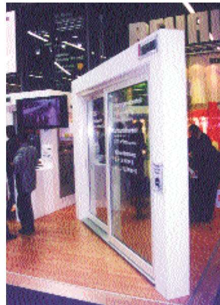
На выставке fensterbau / frontale в Нюрнберге

ООО «ССК-Информ» — соучредитель и участник Ассоциации пресовщиков алюминия (АПРАЛ).