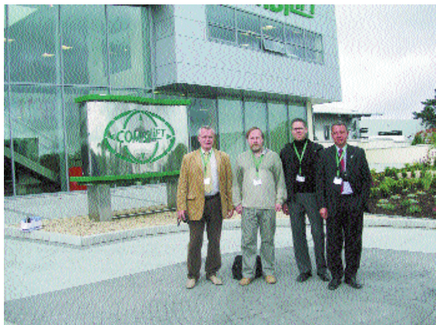
Посещение предприятия Combilift в Ирландии