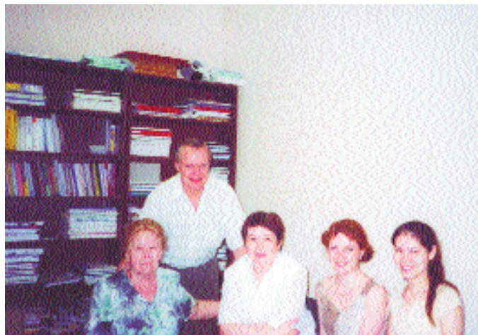
На празднике в редакции журнала