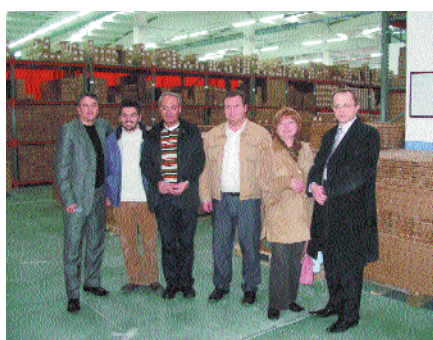
На предприятии Vorpe

Юбилею журнала будет посвящен еще ряд мероприятий, которые состоятся в течение года.