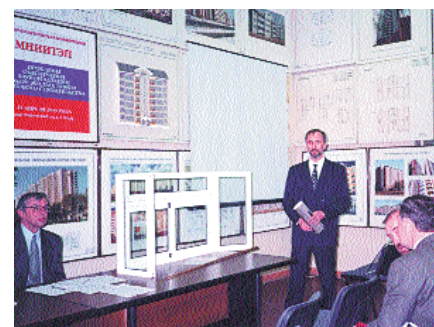
На научно-практической конференции

В декабре организована и проведена научно-практическая конференция «Проблемы проектирования и устройства остекления балконов и лоджий жилых домов». Результат: положительное решение правительства г. Москвы по вопросу остекления балконов и лоджий жилых зданий массовой застройки непосредственно в процессе строительства, а с 2000 г. — при проектировании типовых серий домов.