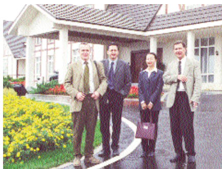
В коттеджном поселке на полуострове Ляодун