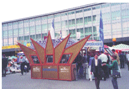
На выставке KievBuild в Киеве