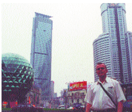
Город Далянь (бывший Дальний)