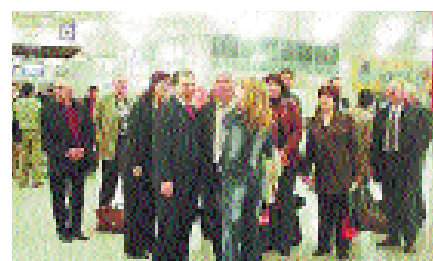
Посещение Window EurAsia 2005