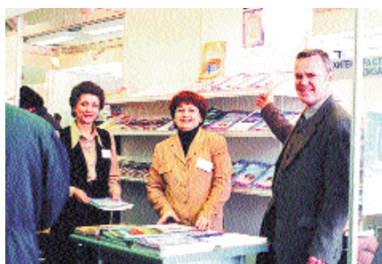
На выставке MosBuild