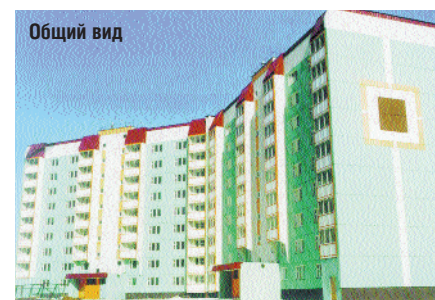
Москва, микрорайон Митино, 8Г, корп. 9 — ограждение лоджий