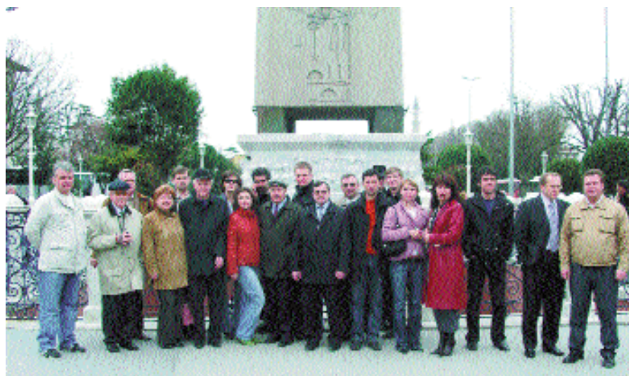
У колонны фараона Тутмоса

Юбилею журнала будет посвящен еще ряд мероприятий, которые состоятся в течение года.