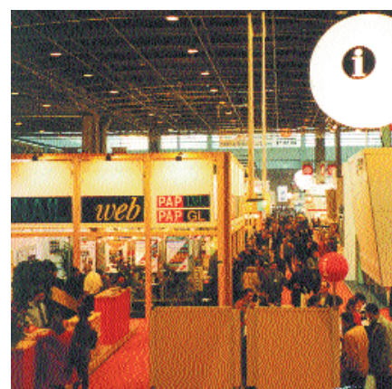
На выставке Batimat в Париже

В декабре организована и проведена научно-практическая конференция «Фасадные системы в современном строительстве. Проблемы и решения».