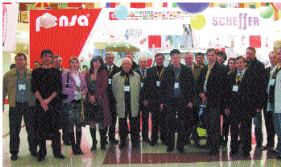
Российская делегация на выставке «Окна Евразии»