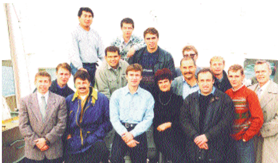
С друзьями, изготовителями окон, на Байкале