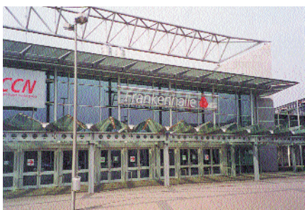
На выставках и конференциях