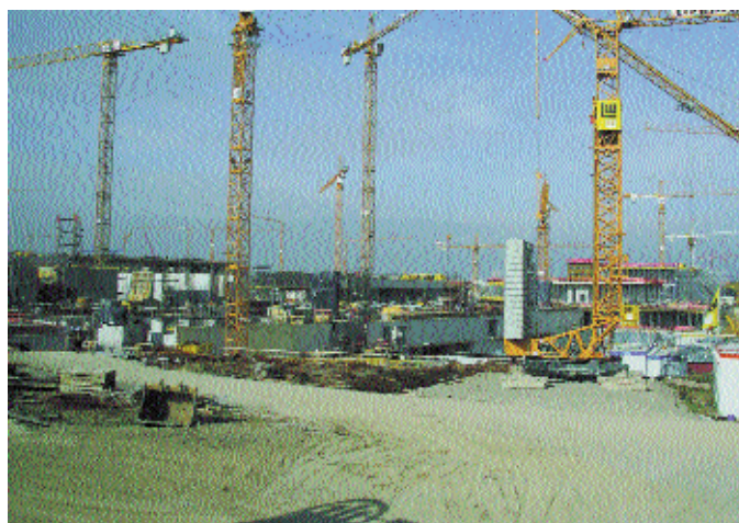
На строящемся комплексе «Мессе Штутгарт»