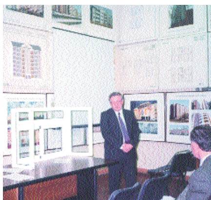
На научно-практической конференции

Подготовлен и издан пилотный выпуск первого каталога-справочника «Комплекующие для окон и дверей».