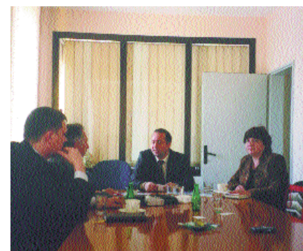
На деловых переговорах

Наряду с собственной сетью распространения ИЦ «Современные Строительные Конструкции», наши издания распространяются также компанией «Интер-Почта» и «Коммерсант-Курьер».