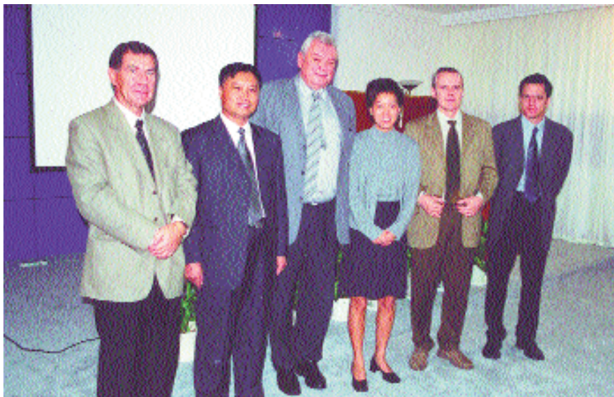
На предприятии «Далиан Шиде» — крупнейшем в мире производителе ПВХ-профиля

На страницах журнала поднят вопрос о реальной «цене энергосбережения».