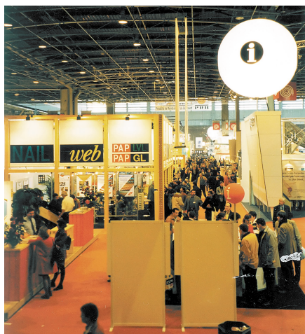
На выставке Batimat в Париже