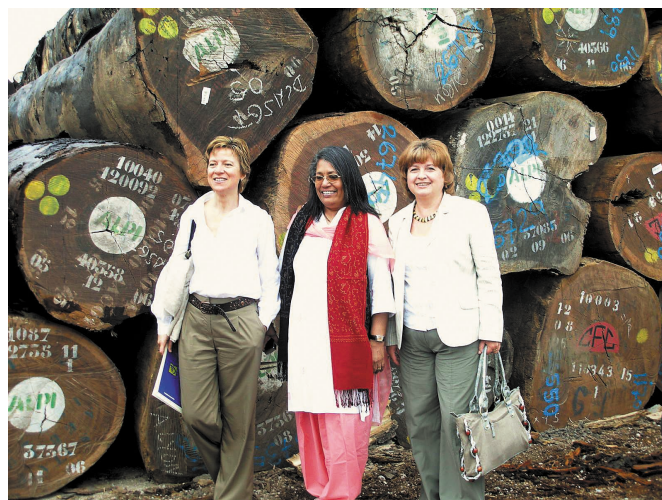
На деревообрабатывающем предприятии в Испании

80-летию кафедры Теплогазоснабжения и вентиляции МГСУ.