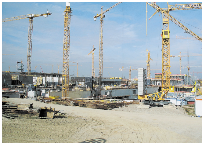
На строящемся комплексе «Мессе Штутгарт»

Организационные мероприятия, связанные с принятием Федерального закона «О техническом регулировании».