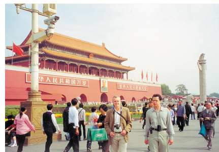
Пекин, площадь Тяньаньмынь