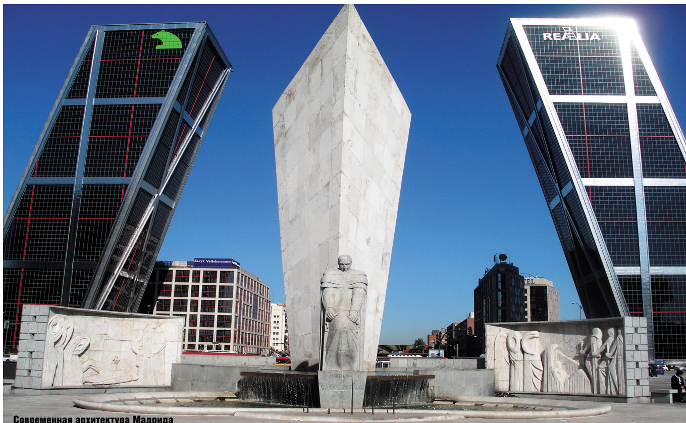
Современная архитектура Мадрида