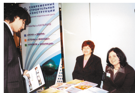
На выставках и конференциях

ООО «ССК-Информ» — соучредитель и участник Ассоциации пресовщиков алюминия (АПРАЛ). Первая Международная конференция и выставка «Алюминий в строительстве».