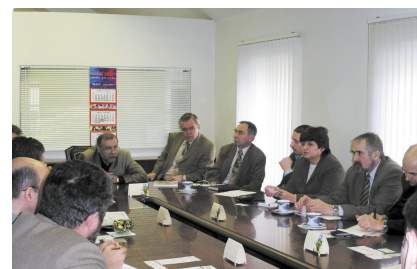
На совещании в Национальном институте технического регулирования

ИЦ «Современные Строительные Конструкции» – информационный спонсор Второй Международной научно-технической конференции «Теоретические основы теплогазоснабжения и вентиляции», посвященной 85-летию Московского государственного строительного университета и