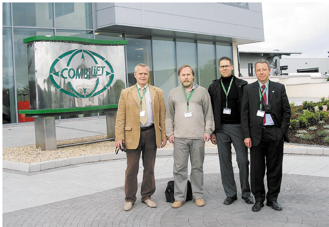
Посещение предприятия Combilift в Ирландии