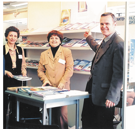
На выставке MosBuild

Налаживается деловое партнерство с зарубежными и отечественными фирмами.