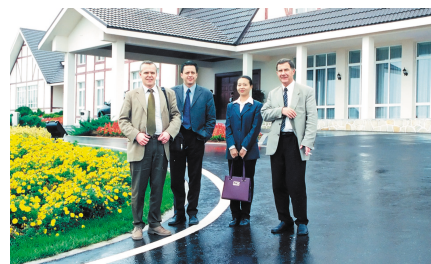
В коттеджном поселке на полуострове Ляодун