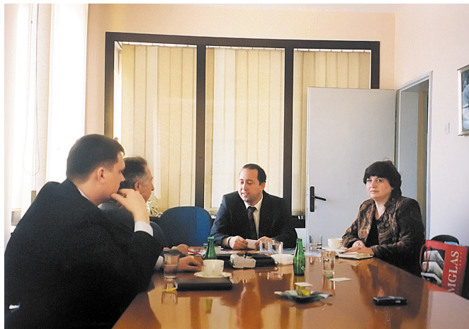
На деловых переговорах в Турции