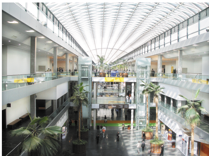
Выставочный комплекс FERIA-Valencia